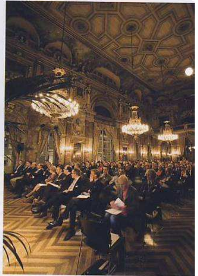
De verkiezing vond plaats in de Vlaamse Opera in Ge