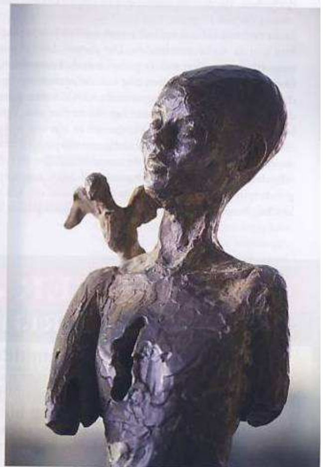
De award, een bronzen beeld, is van de hand van Myriam Lelour