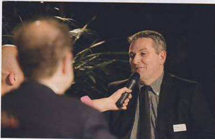
Sebeco huldigde softwarebedrijf Sofico uit Zwijnaarde als 'meest klantvriendelijke onderneming' in de regio Gent.